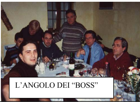
L'ANGOLO DEI "BOSS"

Domenica 6 gennaio, con l'ormai tradizionale pranzo sociale, si è aperto ufficialmente il 10° anno di attività del MOTOCLUB VIZZOLO.