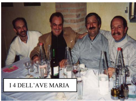
I 4 DELL'AVE MARIA