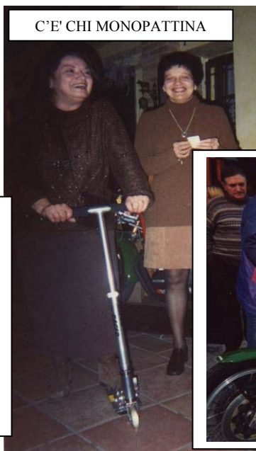
C'E' CHI MONOPATTINA