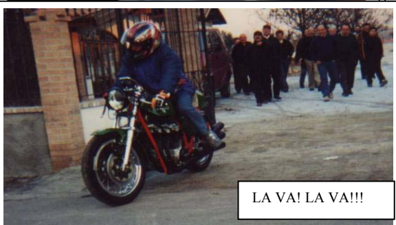
LA VA! LA VA!!!