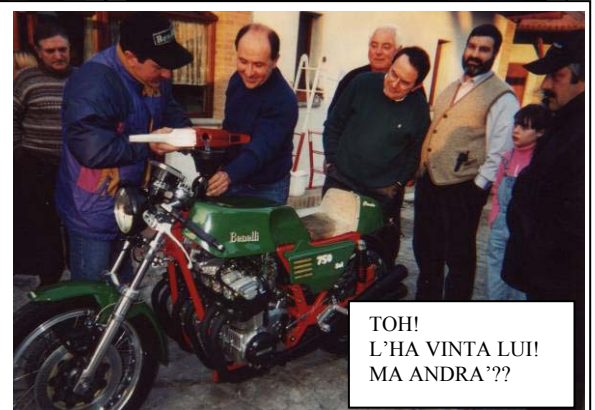
TOH! L'HA VINTA LUI! MA ANDRA'??