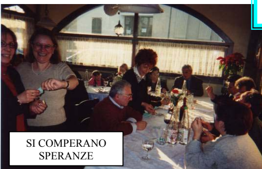
SI COMPERANO SPERANZE