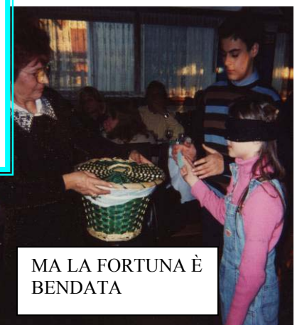
MA LA FORTUNA È BENDATA