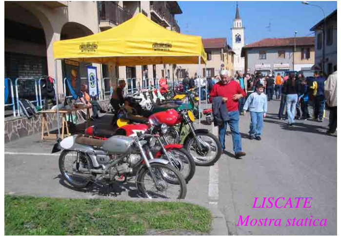
LISCATE Mostra statica