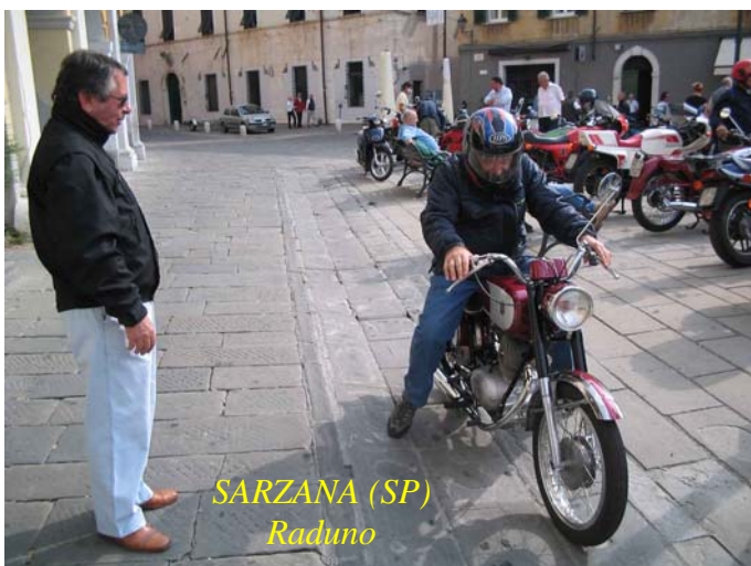
SARZANA (SP) Raduno