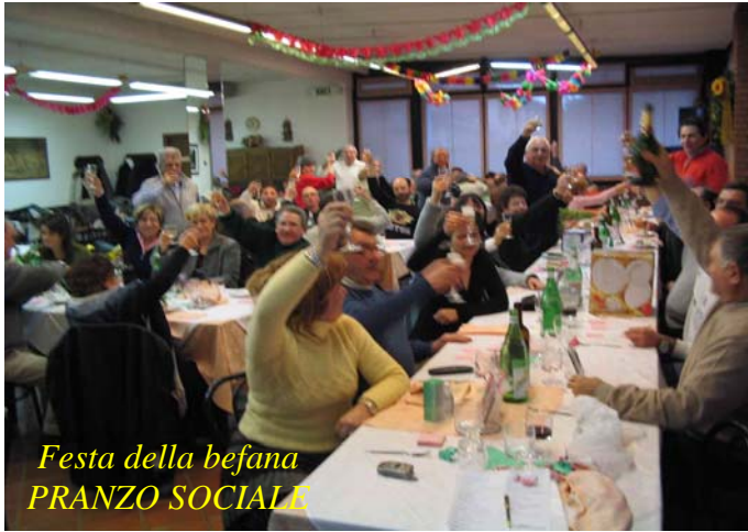
Festa della befana PRANZO SOCIALE