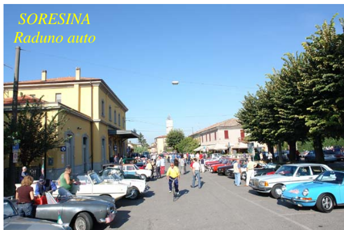
SORESINA Raduno auto