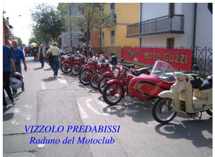
VIZZOLO PREDABISSI Raduno del Motoclub