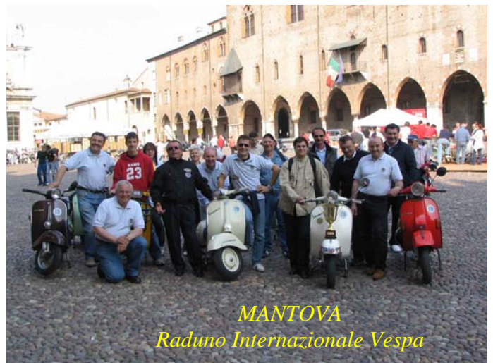
MANTOVA Raduno Internazionale Vespa