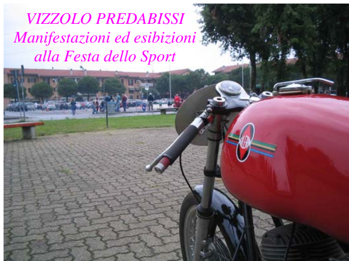
VIZZOLO PREDABISSI Manifestazioni ed esibizioni alla Festa dello Sport

E come al solito tanti altri raduni non documentati da foto, ai quali molti soci hanno partecipato in forma più o meno privata, portando però e comunque il nome del Motoclub Vizzolo un pò d'ovunque in giro per l'Italia.