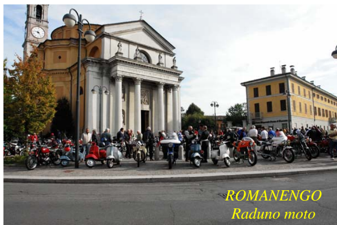
ROMANENGO Raduno moto