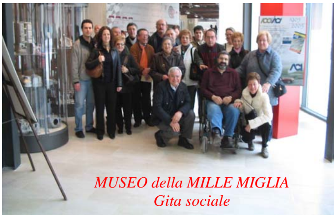
MUSEO della MILLE MIGLIA Gita sociale