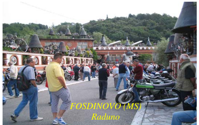
FOSDINOVO (MS) Raduno